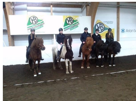
Frá KB mótarað, 15.03.2015