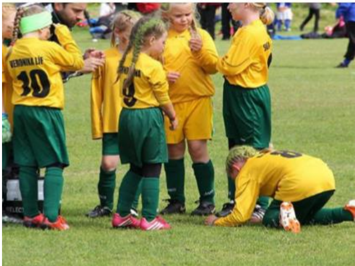
Mynd: Ungar stúlkur á síamóttinu 2014

Knattspyrnudeildin heldur úti æfingum fyrir yngri flokka og geta börn frá leikskólaaldri og upp úr mætt á æfingar hjá menntuðum þjálfurum í hverri viku. Rúmlega 100 iðkendur voru skráðir hjá deildinni í yngri flokkum í byrjun árs en við það bætast síðan leikskólakrakkar sem æfa tvisvar í mánuði hjá deildinni í kynningaverkefni. Í lok árs voru iðkendur orðnir um 120 og er von deildarinnar að þeim fjölgi enn frekar. Yngri flokkarnir voru duglegir að taka þátt í fjölíðamótum yfir sumartímann og tóku meðal annars þátt í Norðurálsmóttinu á Akranesi, þæjumóttinu í Eyjum, N1 móttinu á Akureyri og Síamótti Breiðabliks svo eitthvað sé nefnt. 4., 5. og 6. flokkur drengja tók þátt í Íslandsmóttinu og 5. og 6. flokkur stúlkna. Fjölgun iðkenda var mikil árið 2014 og fram á sumar 2015 og hefur sá fjöldi staðið í stað. Vel hefur gengið að halda eldri iðkendum inni í starfinu og er stefnt á að 7 flokkar Skallagríms taki þátt í Íslandsmóttum 2016.