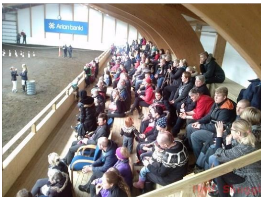
Frá Æskulýðsdegi Skugga, 29.05.2015