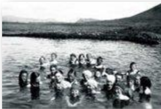
Sundkennsla í torflauginni 1929