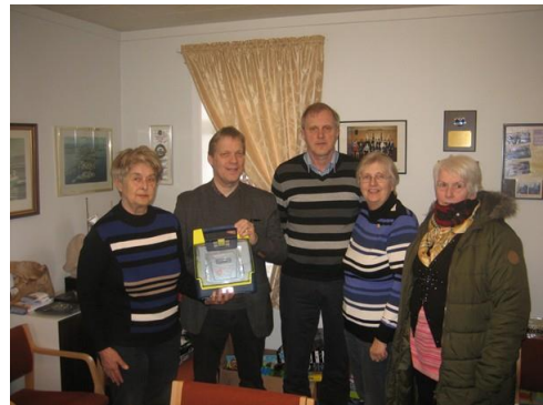
Afhending hjartastuðtækis, frá Öglum

Þá má einnig geta þess að Lionsklúbburinn Agla færði, í apríl-mánuði s.l., okkur Skugga mönnum að gjöf hjartastuðtæki – sem komið hefur verið fyrir á ganginum í félagsheimilinu. Tæki þessarar gerðar hafa sannað notagildi sitt og bjargað mannlífum og þó að ég voni innilega að aldrei þurfi að nota þetta tæki, þá er þetta mjög höfðingleg gjöf, frá þeim Öglukonum og eru þeim færðar hjartans þakkir fyrir gjöfina og kærleikann sem fylgir henni.