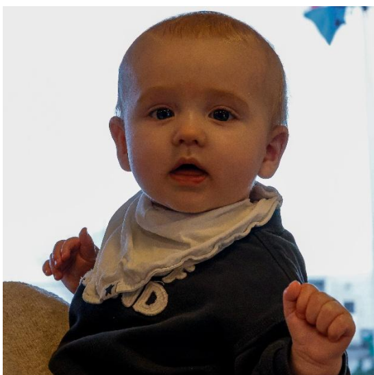
Gestir voru á öllum aldri.